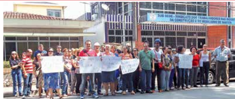
Indignados com a falta de condições de trabalho no Fórum da Comarca, servidores de Cubatão protestam

Preocupados com os servidores, Assojubs e Sintrajus ressaltaram no encontro com o juiz o ocorrido na Comarca de Atibaia, onde houve a interdição do prédio por uma situação semelhante, com rachaduras nas paredes e erosão do piso. Mari-