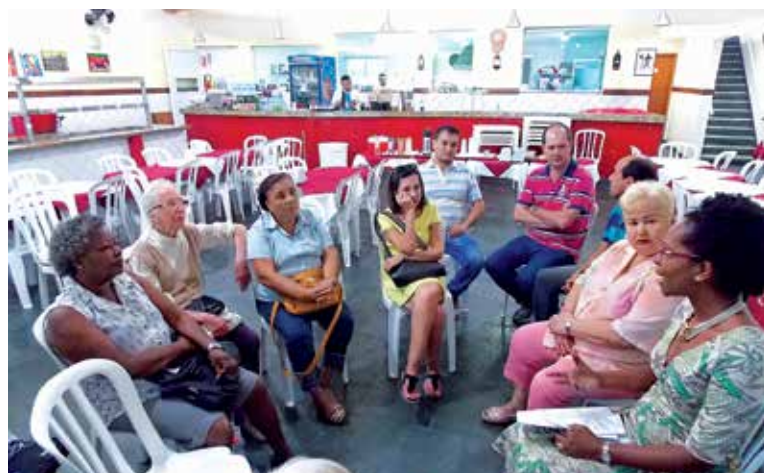
Em mais um encontro do Núcleo dos Aposentados da Assojubs o Iamspe foi o tema da discussão, bem como a luta da Comissão Consultiva Mista, plenária de entidades representativas dos servidores que milita em prol do Instituto

A secretária geral da Assojubs explanou acerca da impor-