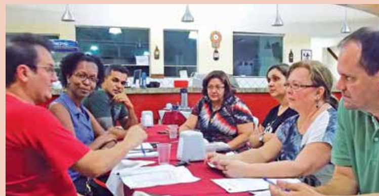
Núcleo de Escreventes da Assojubs retomou os debates acerca da função

cessidade da exigência do nível universitário para ingressar no cargo (item de pauta), gratificação específica para a função, valorização da carreira, a necessidade de dispor de atualização dos servidores no quesito informática, pois os escreventes vêm sendo mais exigidos por parte do TJ-SP, e melhores condições de trabalho.