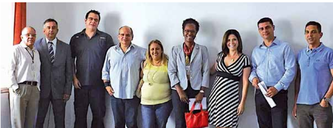
A CGOJ com os participantes da discussão e outros membros de sua formação

Com informações e fotos da Comissão Geral dos Oficiais de Justiça