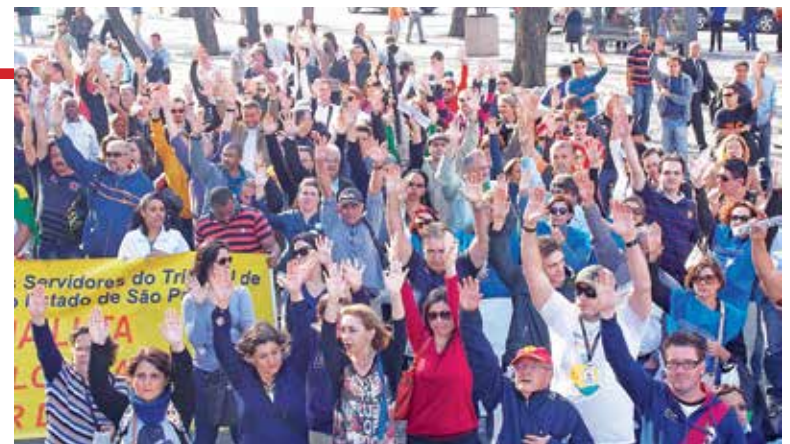
Judiciários de diferentes comarcas do Estado na Pça. João Mendes (SP)

- organizar a pauta em itens prioritários como: reajustes passados, adicional de qualificação, projetos aguardando votação na Alesp, nível universi-