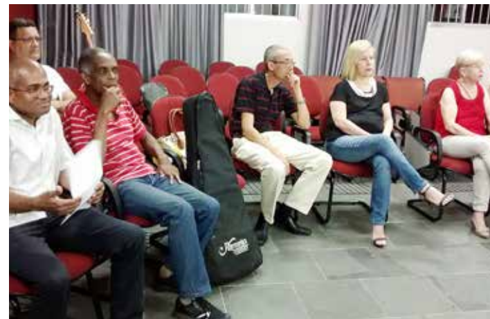
Com apresentações musicais, de poemas, poesias e dinâmica em grupo, aconteceu o 2º Sarau Cultural da Assojubs

Ao final das apresentações, uma pequena recepção foi servida aos participantes do 2º Sarau Cultural da Assojubs.