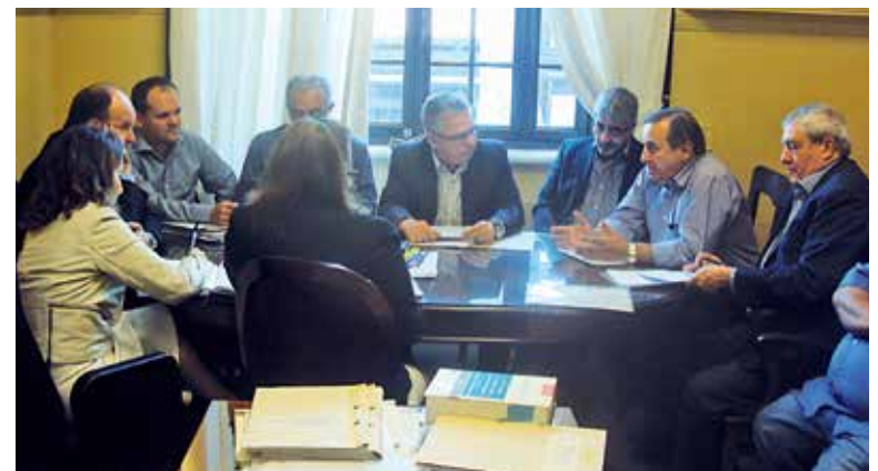
Assojubs e dirigentes em tratativa com o Tribunal de Justiça sobre a forma de aplicação do Adicional de Qualificação aos servidores