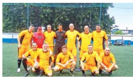
Meninos da Vida/Praia Grande